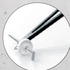
Stabiler Peilstab in H-Form