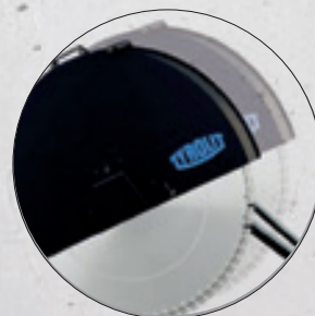
Schnell und einfach von Links- auf Rechtsschnitt umbaubar